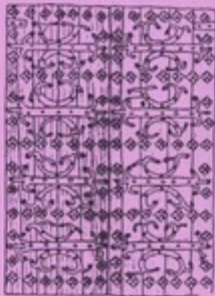
ESTRELLA. San Pedro de Lupata, Puerco